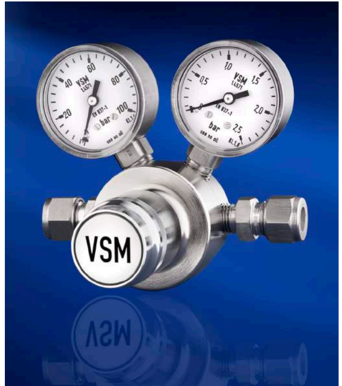
Prüfdruck 400 bar